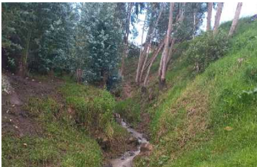
FIGURA N°02:TRAMO CRÍTICO EN LA QUEBRADA EL CARMEN , DISTRITO DE CACHICADAN, PROVINCIA DE SANTIAGO DE CHUCO- DEPARTAMENTO LA LIBERTAD.