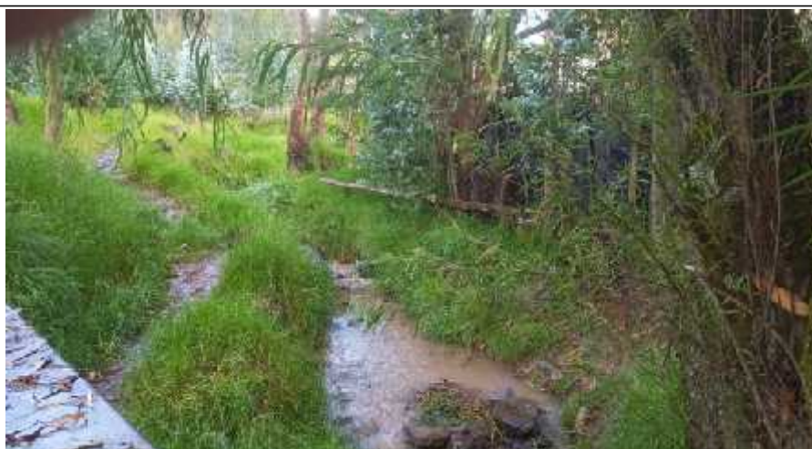
FIGURA N°03TRAMO CRÍTICO EN LA QUEBRADA EL CARMEN , DISTRITO DE CACHICADAN, PROVINCIA DE SANTIAGO DE CHUCO- DEPARTAMENTO LA LIBERTAD.