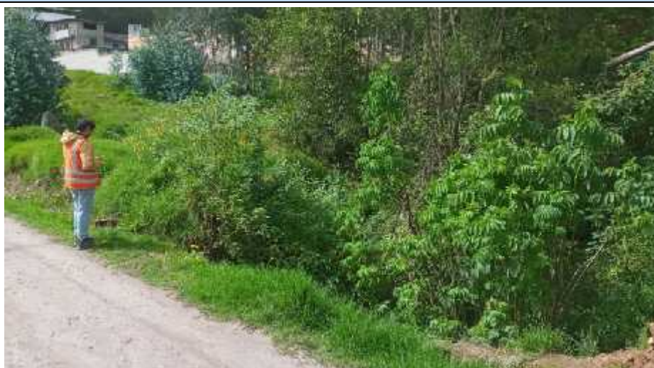
FIGURA N°01: TRAMO CRÍTICO EN LA QUEBRADA EL CARMEN , DISTRITO DE CACHICADAN, PROVINCIA DE SANTIAGO DE CHUCO- DEPARTAMENTO LA LIBERTAD.